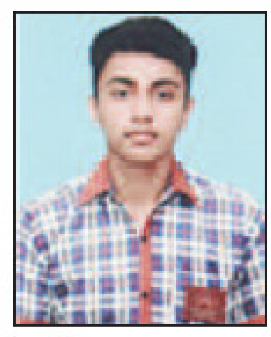
आर्शिवाद कुमा र 95.4%